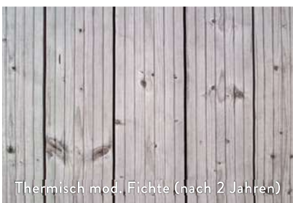
Thermisch mod. Fichte (nach 2 Jahren)