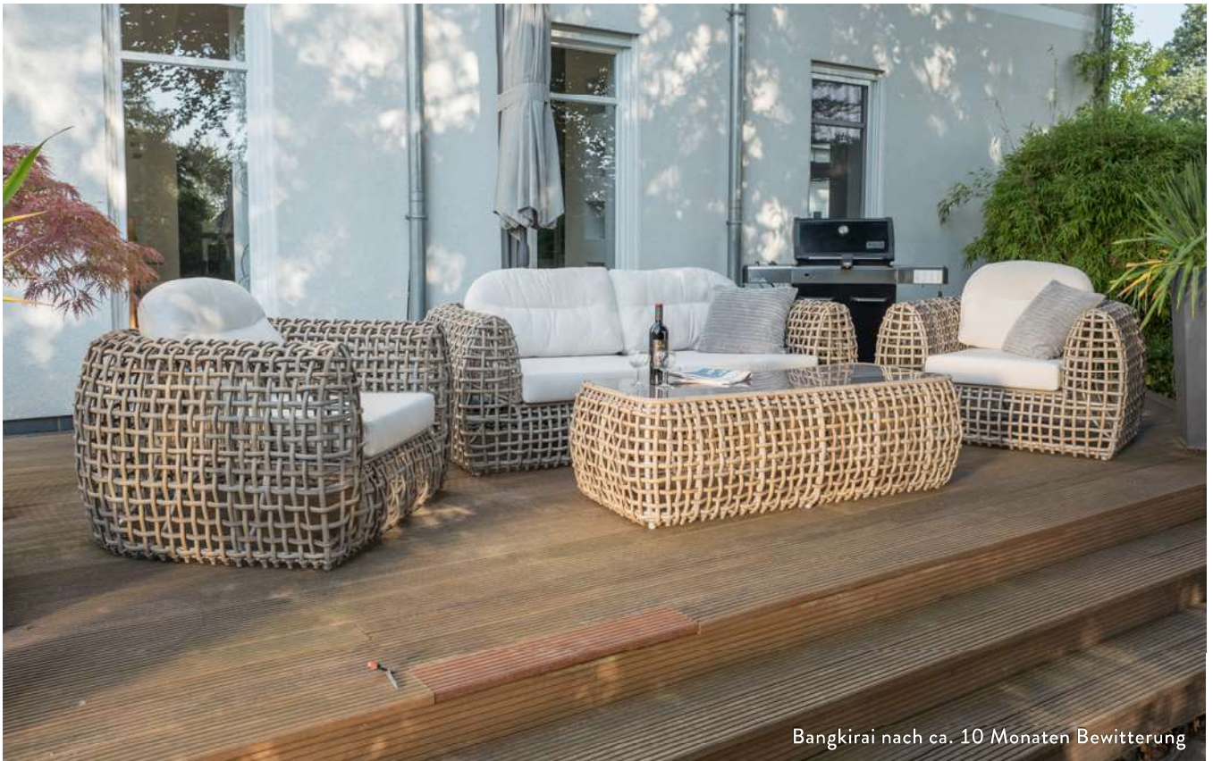
Bangkirai nach ca. 10 Monaten Bewitterung