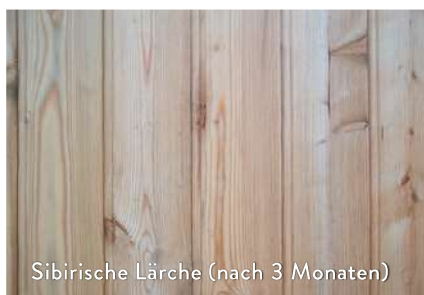
Sibirische Lärche (nach 3 Monaten)